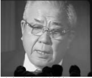
ビデオ出演の野村監督