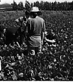
小豆作況調査風景(2001年)

現在の会員は、正会員の商品取引員および取引所、関連団体が三十八、新聞・通信・雑誌などの特別会員が三十一社。調査部会活動の影響は大きい。